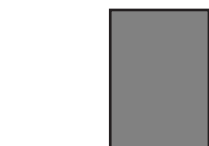
1/1 sivu 210 x 280 mm tai kehys 185x237